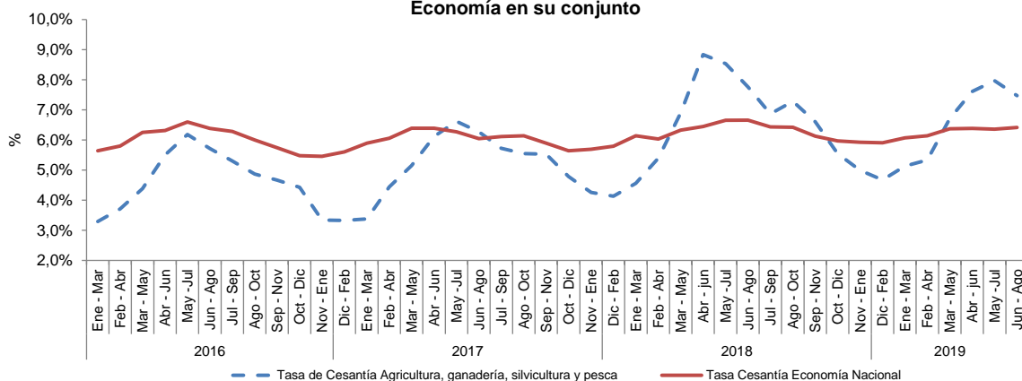
Gráfico 2. Tasa de Cesantía: Agricultura, Ganadería, Silvicultura y Pesca versus Economía en su conjunto